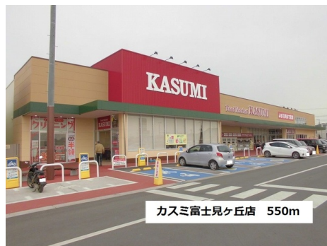
カスミ富士見ヶ丘店 550m