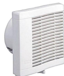
24時間換気システム