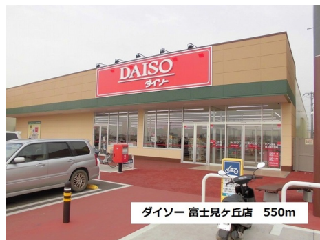
ダイソー 富士見ヶ丘店 550m