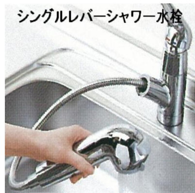
シングルレバーシャワー水栓