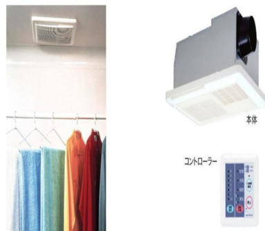
24時間換気機能付浴室乾燥システム

嬉しい都市ガスインターネット無料の2LDK☆ウォークインクローゼット付きだから荷物もカンタン収納!よりお部屋を広く☆契約金・毎月のお家賃もクレジットカード払い選択可能!!お問い合わせはアパマンショップ守谷店へTEL:0297-44-7020♪